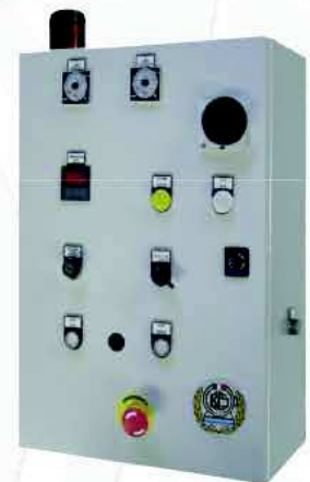
Caratteristiche tecniche - Technical data

ZAPPONATRICI ZAP CVR are suitable for impregnation, painting, lubrication and sealing of small pieces, loaded in bulk into the basket.