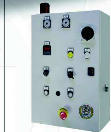
Caratteristiche tecniche - Technical data