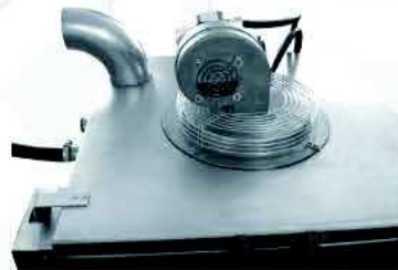
Ventilatore con resistenza Fun with resistance